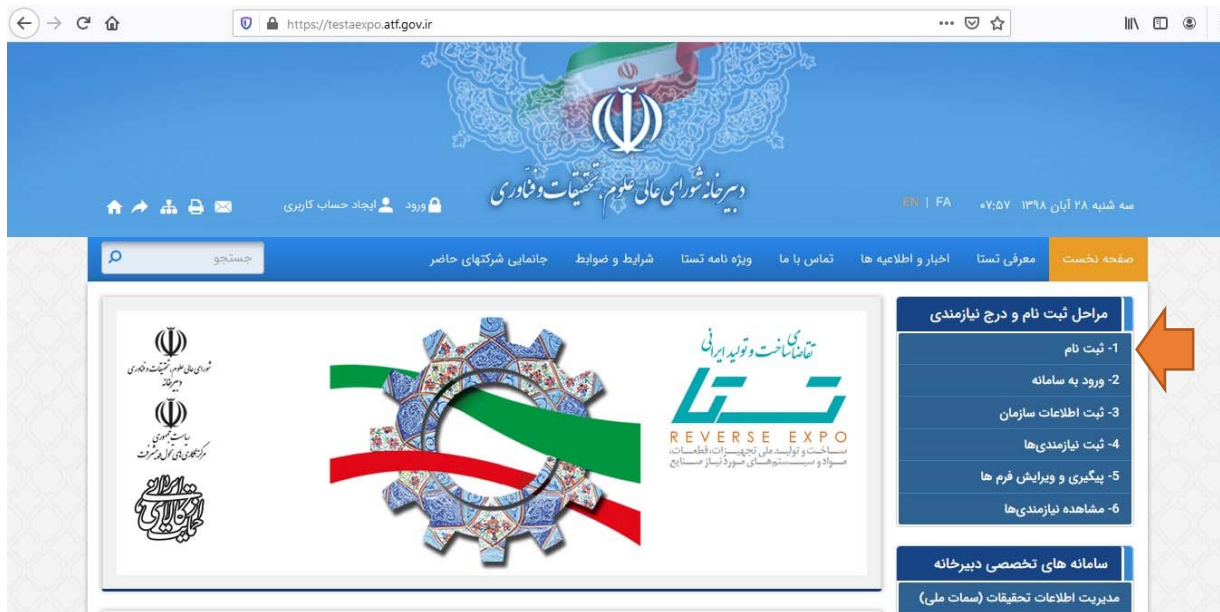
شکل ۳: صفحه نخست سامانه تستا

پس از مطالعه آیین نامه و ضوابط ثبت نام، از لینکهای موجود در صفحه نخست سامانه https://testaexpo.atf.gov.ir روی لینک ثبت نام کلیک کنید. شکل (۳)